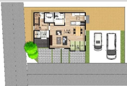
2020年義務化改正省エネ基準

1F床面積/54.24㎡ 2F床面積/53.41㎡ 延床面積:107.65㎡ (32.57坪) 施工面積:112.20㎡ (33.94坪)