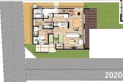
2020年義務化改正省エネ基準